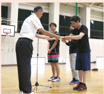
ソフトバレーボール大会表彰式

営協力して頂いています 公民館委員の皆様が、「仲良く・楽しく交流できる」と感じて頂けるような公民館活動を目指していきたいと思っています。