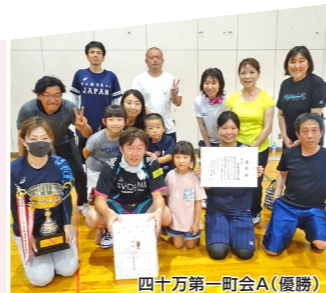
四十万第一町会A(優勝)